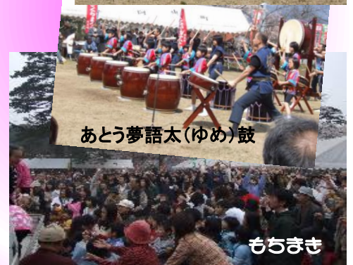
あとう夢語太(ゆめ)鼓